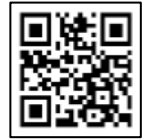
購入サイト QR コード

購入サイトご案内資料 : https://www.tgu.ac.jp/byod/jbd.pdf